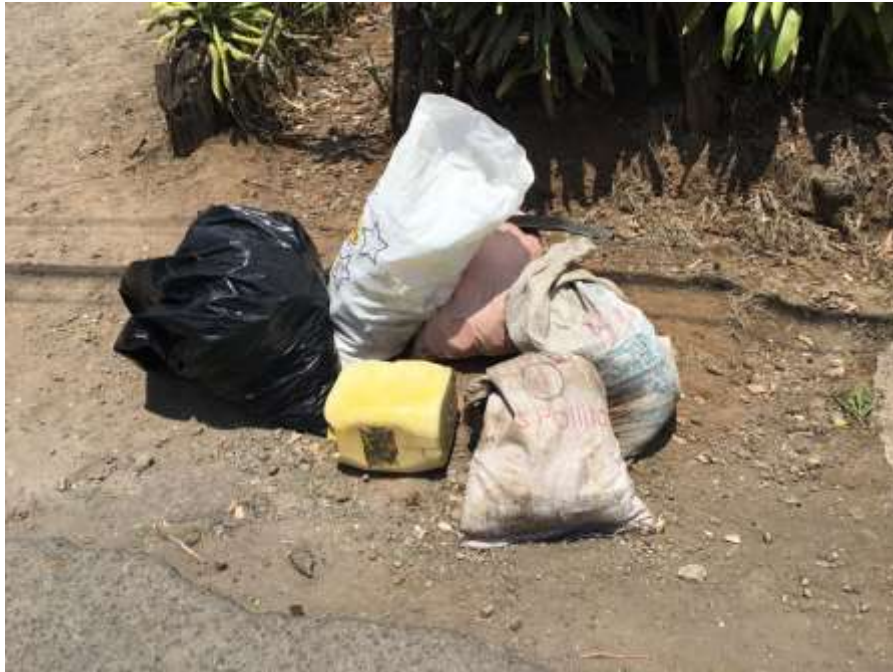
Imagen 6. Parte de los residuos extraídos