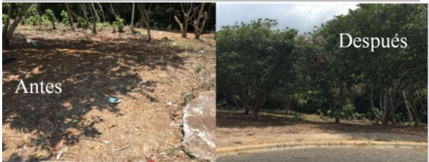
Imagen 10. Limpieza de lote municipal

Como parte de la información a la comunidad, se contrató perifoneo para el distrito de la Granja para el día antes y se divulgó mediante redes sociales (Facebook y Whatsapp) (Imagen 11).