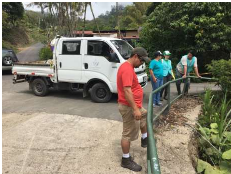
Imagen 9. Vehículo municipal