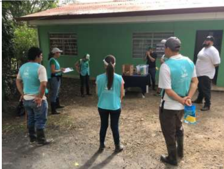
Imagen 3. Entrega de materiales, instrucciones y palabras de motivación.

Una de las colaboradoras realizó trabajo directo con la comunidad mediante la repartición de boletines informativos que divulgaban la campaña de recolección de residuos no tradicionales organizada por la Municipalidad para días próximos (Imagen 4) (Anexo 2), los representantes de la Municipalidad y el SINAC tuvieron a cargo la recolección y traslado de residuos al parqueo municipal, mientras que los demás trabajaron en el cauce, propiamente (Imagen 5, 6, 7 y 8).