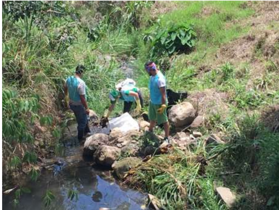
Imagen 8. Trabajo en la Quebrada