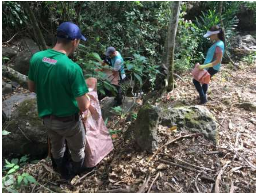
Imagen 7. Trabajo en la Quebrada