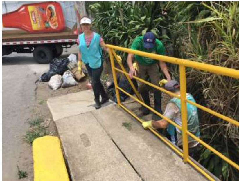
Imagen 5. Trabajo en la Quebrada

Una vez finalizada la jornada los (as) participantes se reunieron para compartir criterios y un refrigerio.