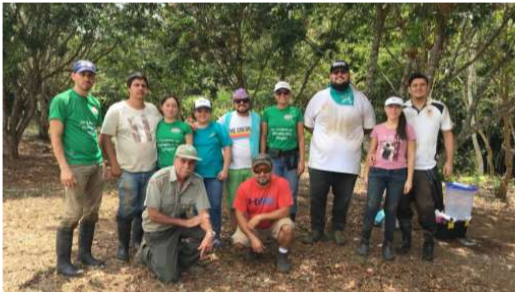
Imagen 1. Participantes de limpieza de Quebrada Calabazo 2018

El equipo de trabajo estuvo compuesto por miembros de la Fundación Madre Verde, miembros de Covirenas, Sociedad Civil, funcionarios públicos (SINAC y Municipalidad), así como una trabajadora de la empresa privada RYV Contadores-Consultores. En total se contó con 12 colaboradores, 4 de ellas mujeres y 8 hombres (Imagen 1, Anexo 1).