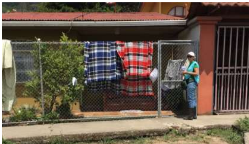
Imagen 4. Entrega de boletines casa a casa.

Una de las colaboradoras realizó trabajo directo con la comunidad mediante la repartición de boletines informativos que divulgaban la campaña de recolección de residuos no tradicionales organizada por la Municipalidad para días próximos (Imagen 4) (Anexo 2), los representantes de la Municipalidad y el SINAC tuvieron a cargo la recolección y traslado de residuos al parqueo municipal, mientras que los demás trabajaron en el cauce, propiamente (Imagen 5, 6, 7 y 8).