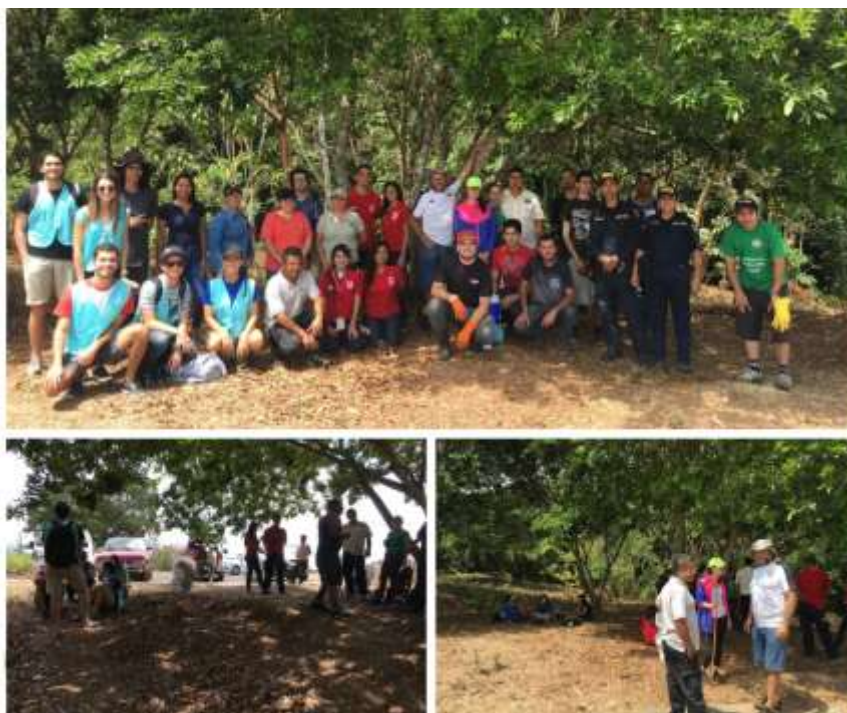
Imagen 5. Cierre de la Campaña