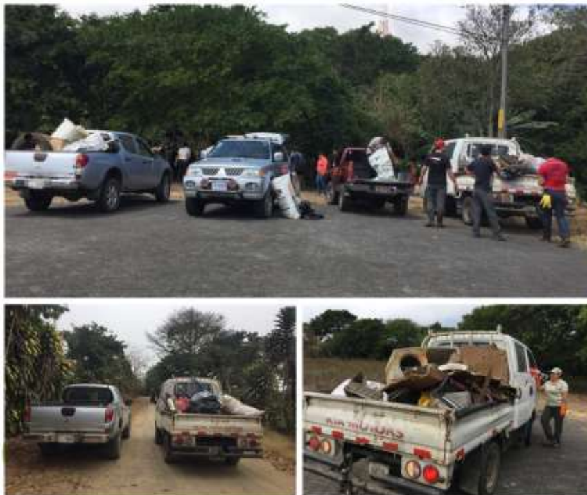
Imagen 4. Vehículos de apoyo logístico durante la Campaña