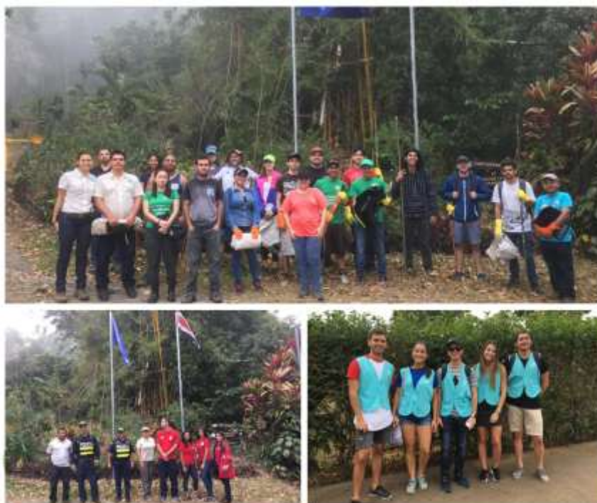
Imagen 1. Participantes de limpieza de Quebrada Calabazo 2019

El equipo estuvo compuesto por miembros de la Fundación Madre Verde (3), miembros de Covirenas (2), Sociedad Civil (5), Miembros de Cruz Roja Juventud (4), comités de Bandera Azul (3), funcionarios públicos (5) (SINAC- Municipalidad-Fuerza Pública), Asociación de Desarrollo Integral de La Granja (2), estudiantes universitarios (5), así como representantes de la empresa privada Grupo Favarcia S.A (5). En total se contó con 34 colaboradores, 13 de ellas mujeres y hombres (Imagen 1, 2) (Anexo 1).