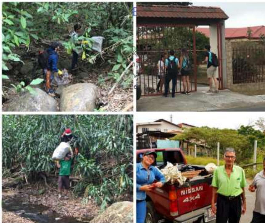
Imagen 3. Labores realizadas durante campaña

Los representantes de la Municipalidad y el SINAC tuvieron a cargo la recolección y traslado de residuos al parqueo municipal. Los residuos que se sacaron del cauce se clasificaron en “basura” y en residuos valorizables. En total se contó con el apoyo de 4 vehículos para la logística de la actividad (Imagen 4).