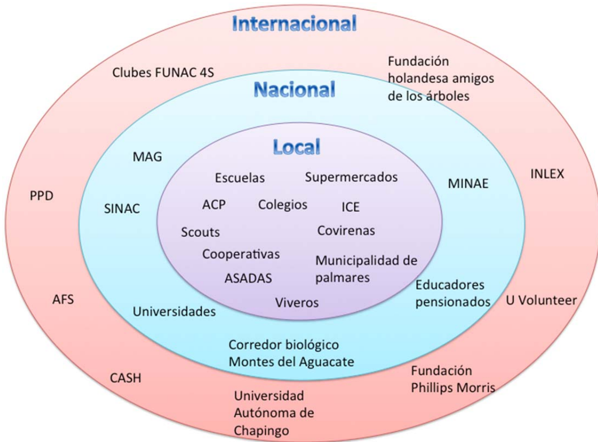
Gráfica n°1, Elaboración propia

Las organizaciones nombradas en la gráfica n° 1 colaboraron en las distintas etapas de creación y sostenimiento de la fundación, ofreciendo recursos económicos y humanos de forma voluntaria, con diferentes niveles de incidencia tanto local, nacional e internacional. A continuación se describirá la participación de las personas, instituciones y organizaciones que ayudaron a la Fundación con su propósito.